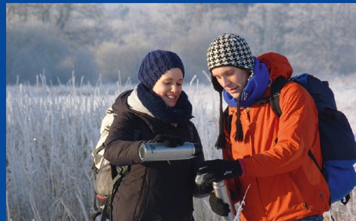
Winterwanderung auf dem Qualitätswanderweg NORDPFAD Hölzerbruch-Malse