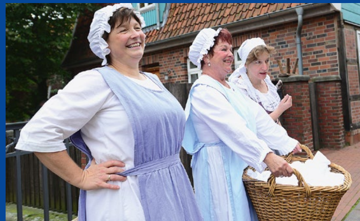
Erlebnissführung über die Welt der Hanse